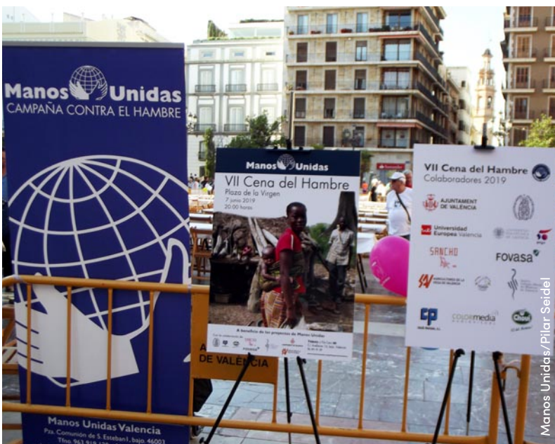
Manos Unidas/Pilar Seidel