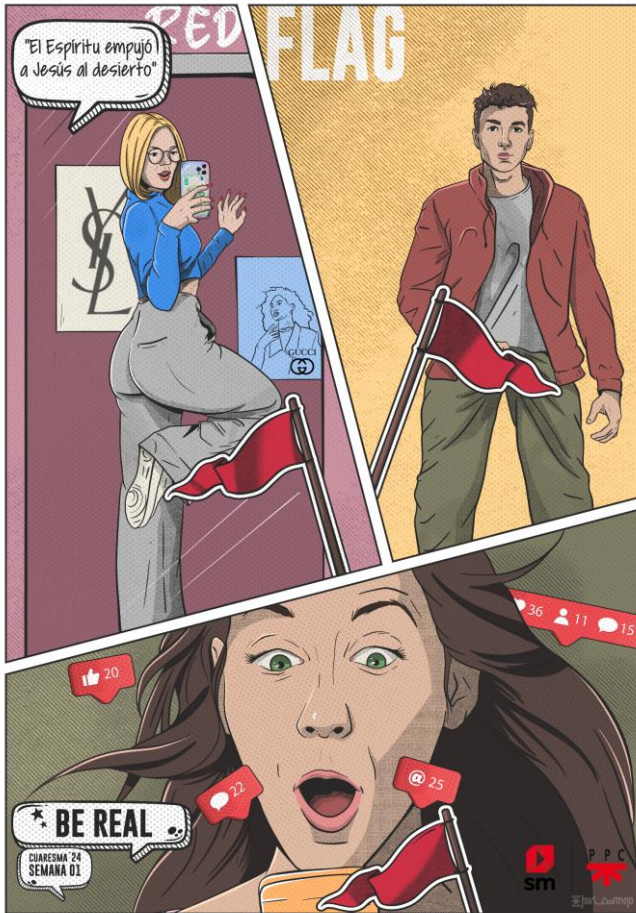
IMAGEN DE LA SEMANA

VEMOS EN LA PRIMERA IMAGEN A TRES ADOLESCENTES QUE TIENEN ACTITUDES QUE NO SON LAS MÁS ADECUADAS. ADEMÁS DE ACTITUDES SON TENTACIONES EN LAS QUE A VECES CAEMOS TODOS Y QUE PODEMOS RESUMIR EN TRES QUE COMO LAS “ALIMAÑAS” DEL DESIERTO, EN LAS TENTACIONES DE JESÚS, HACEN QUE TRANSITEMOS LUGARES NO DESEADOS.